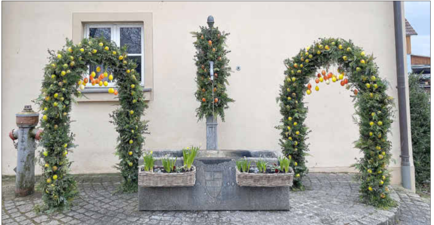
Osterbrunnen in Pferdsfeld – Foto: Markt Ebenfeld

Amtliches Bekanntmachungsorgan des Marktes Ebenfeld