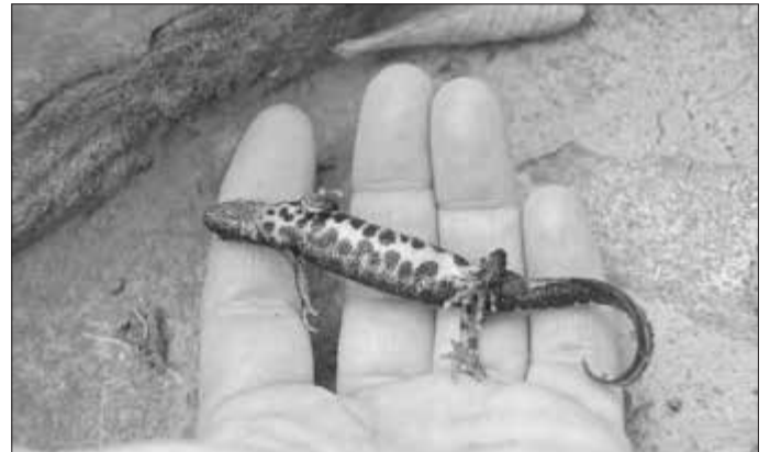
Deutlich gefärbter Bauch vom Kammolch (Ebert 2021)