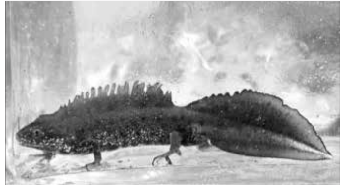
Kammolch (Ebert 2021)