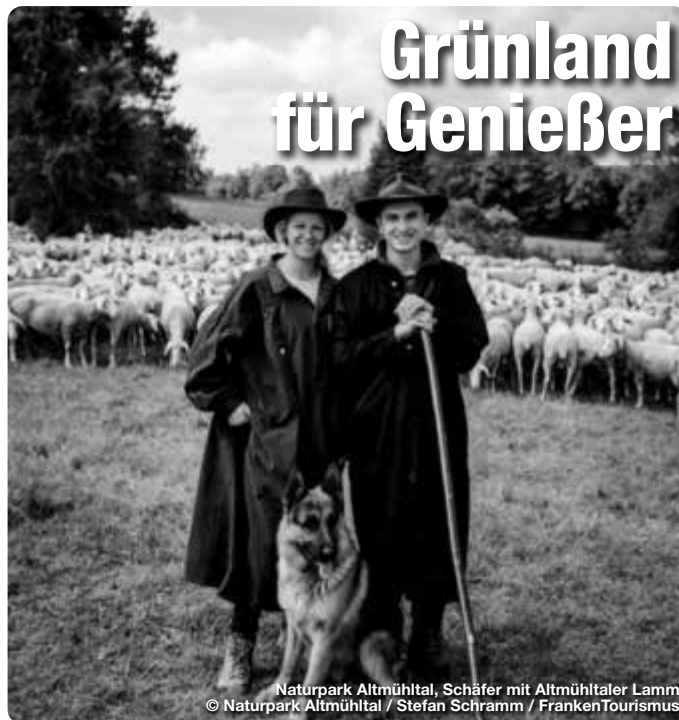
Naturpark Altmühltal, Schäfer mit Altmühltaler Lamm

Das Schöne an den fränkischen Naturparks ist, dass Landschaftsschutz hier sehr gut schmeckt! Viele Flächen, die wichtiger Lebensraum für Tiere und Pflanzen sind, können nur mit tierischer Hilfe erhalten werden. Deren Fleisch wiederum bereichert die regionale Küche. Vor allem Schafe spielen eine große Rolle, was Altmühltaler Lamm, Rhönschafe, Jura-Lamm, Frankenhöhe- oder Hesselberg-Lamm beweisen. Gesellschaft bekommen sie durch Beweidungs-Projekte wie das „Grünland Spessart“. Initiativen wie diese kommen nicht nur der Natur und den Genießern zu Gute: Auch für Landwirte und Schäfer bieten sich durch