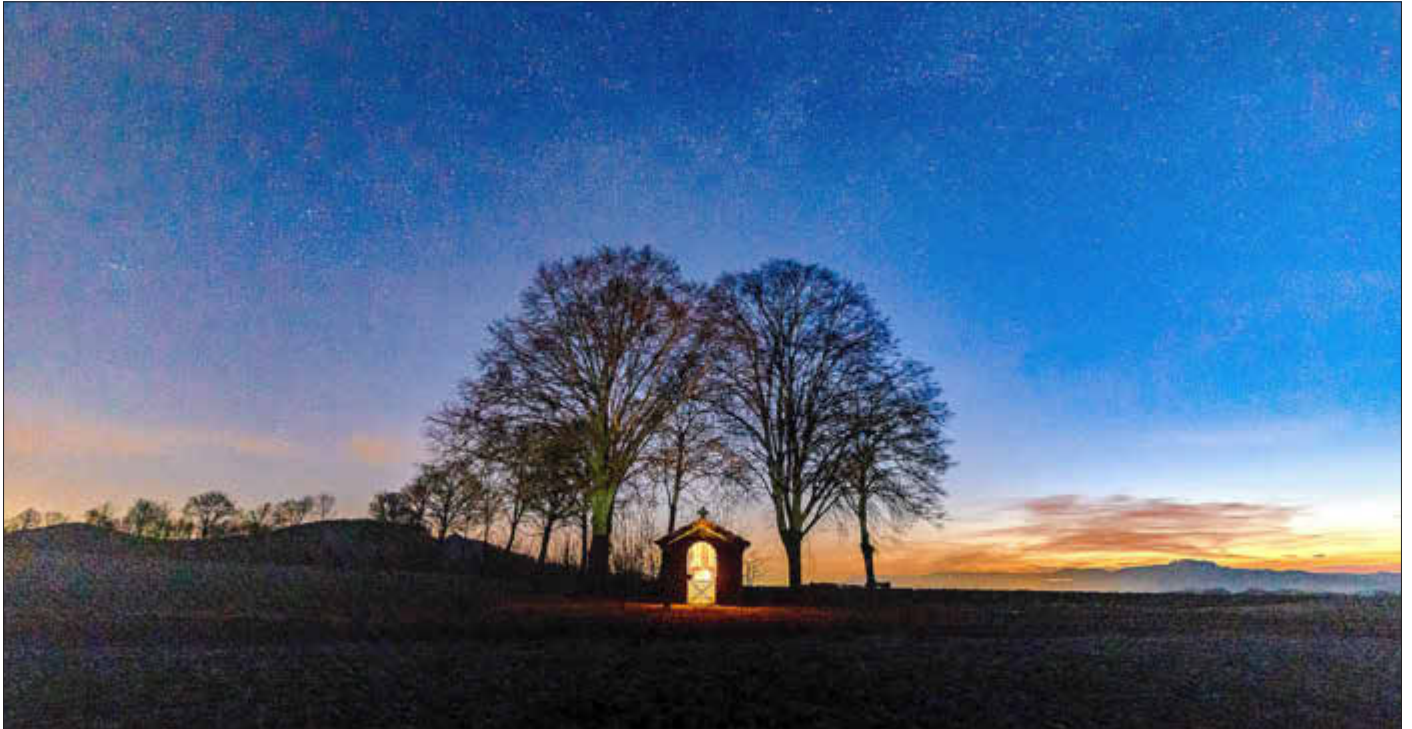
Nachtaufnahme vom Döringstadter Käppala

Amtliches Bekanntmachungsorgan des Marktes Ebensfeld