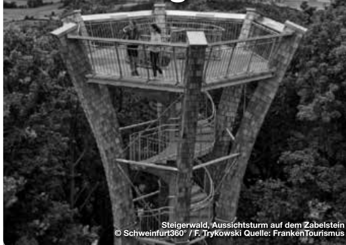
Steigerwald, Aussichtsturm auf dem Zabelstein

Wer sich fragt, was genau eigentlich Nachhaltigkeit bedeutet, dem ist das „Steigerwald-Zentrum – Nachhaltigkeit erleben“ im Oberschwarzacher Ortsteil Handthal eine Hilfe. Es ist eine der vielen Umweltbildungsstätten in den fränkischen Naturparks, die auf interaktive Art Wissenswertes vermitteln. Zu einem Perspektivwechsel lädt außerdem der „Baumwipfelpfad Steigerwald“ in Ebrach ein, der mit dem „Steigerwald-Zentrum“ über einen kurzen Wanderweg verbunden ist. Besonders gut ist die Aussicht auch auf dem Zabelstein: Die höchste Erhebung des nördlichen Steigerwalds wird von einem neuen, über 19 Meter hohen Aussichtsturm gekrönt. Oben weitet sich seine schlanke Holz-Stahl-Konstruktion zu einer „Krone“, von der sich ein Blick bis in die Haßberge und die Rhön bietet. TreffpunktDeutschland.de/steigerwald