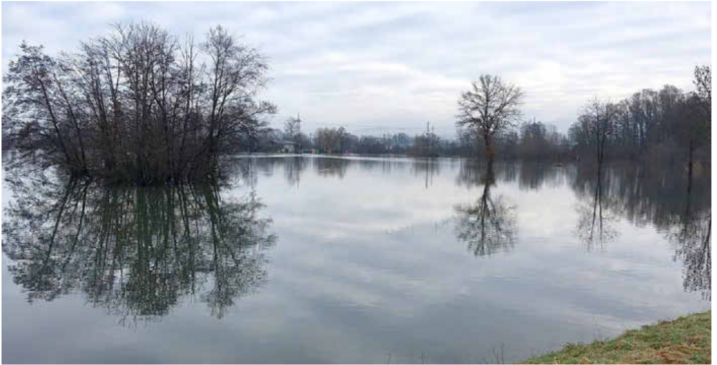
Der Ebenfelder Badensee still und ruhig.

Amtliches Bekanntmachungsorgan des Marktes Ebenfeld