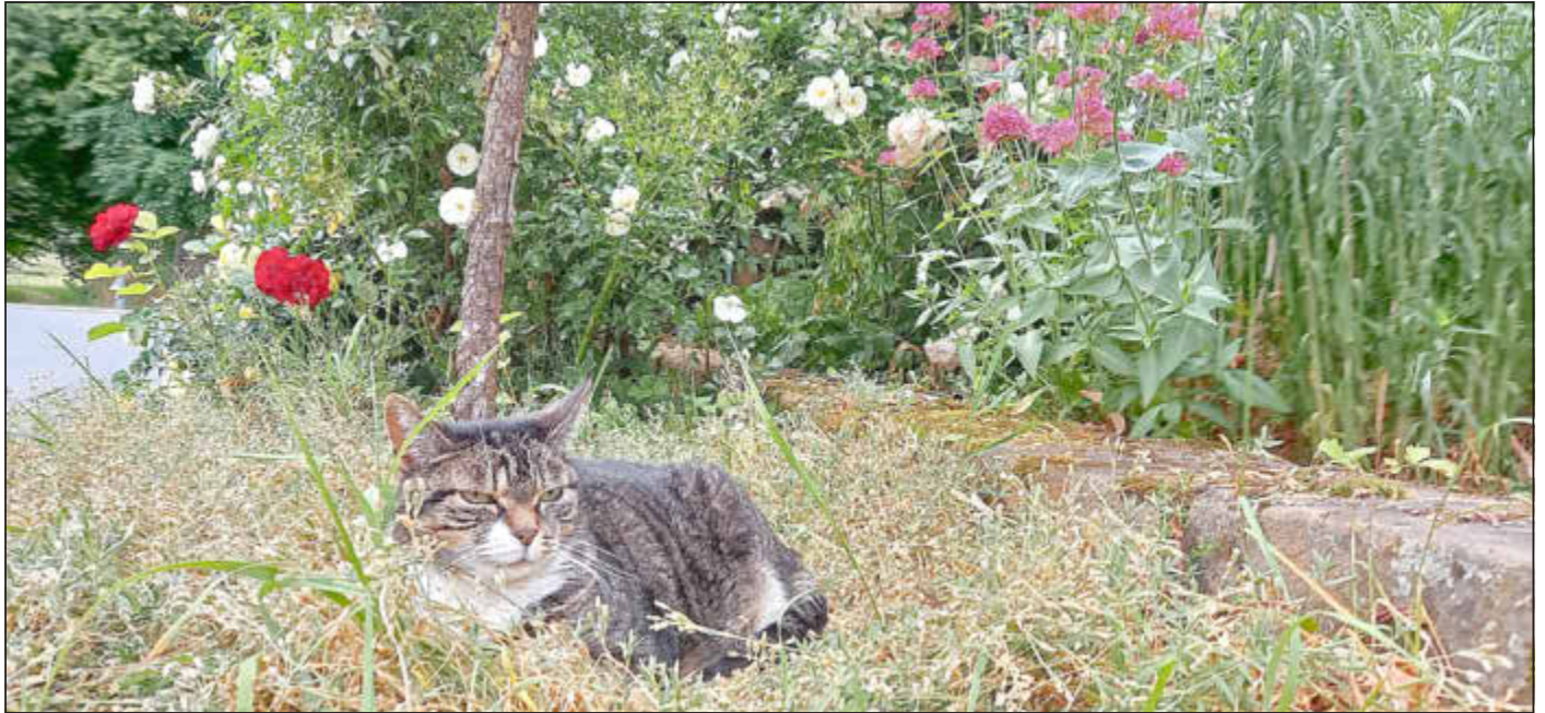
Ein Nickerchen unter Rosen in Neudorf

Amtliches Bekanntmachungsorgan des Marktes Ebensfeld