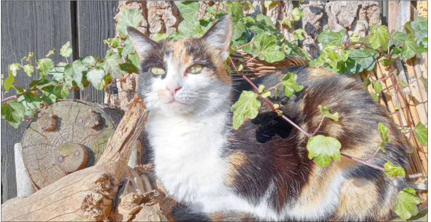
Katze Lissy freut sich in Neudorf über ein Sonnenbad

Amtliches Bekanntmachungsorgan des Marktes Ebenfeld