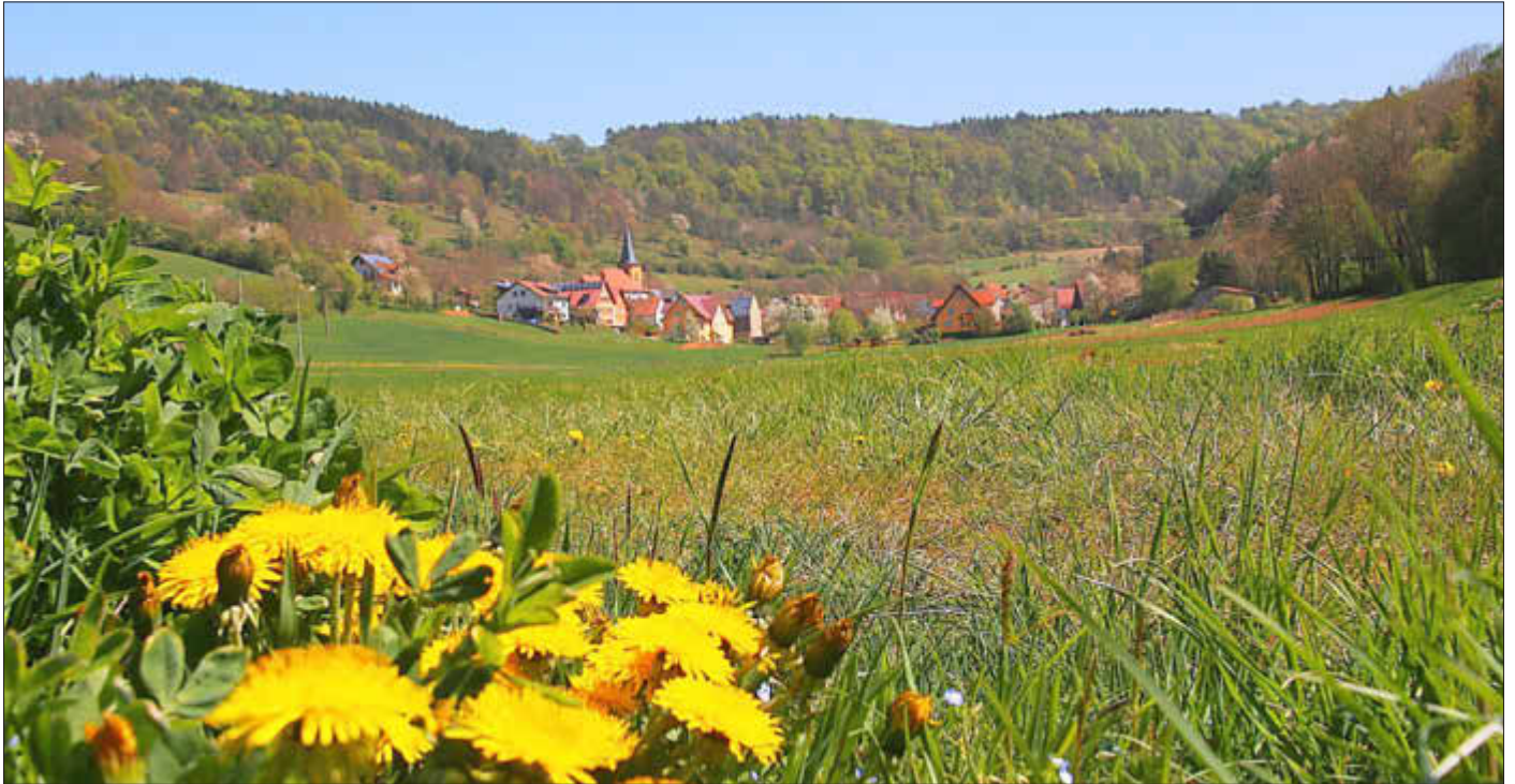
Blick auf Oberküps

Amtliches Bekanntmachungsorgan des Marktes Ebenfeld