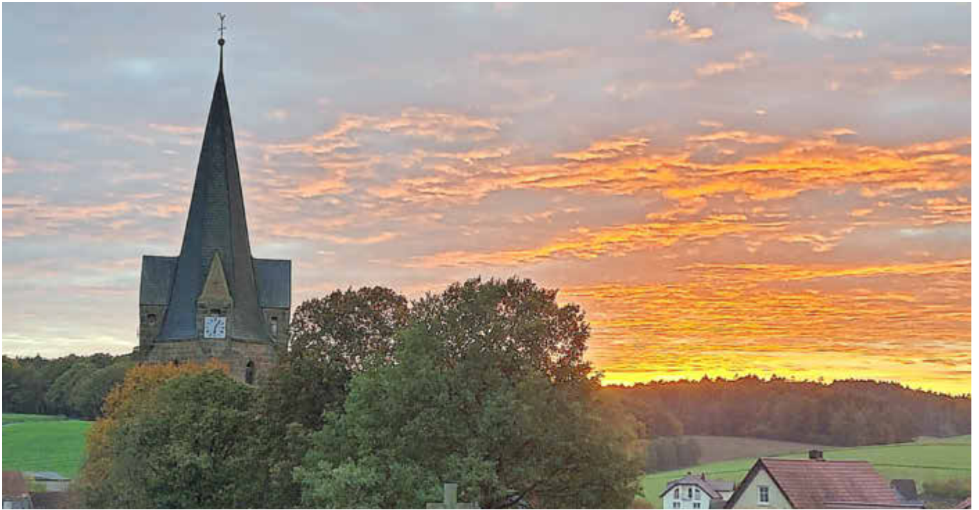
Sonnenuntergang über Döringstadt

Amtliches Bekanntmachungsorgan des Marktes Ebensfeld