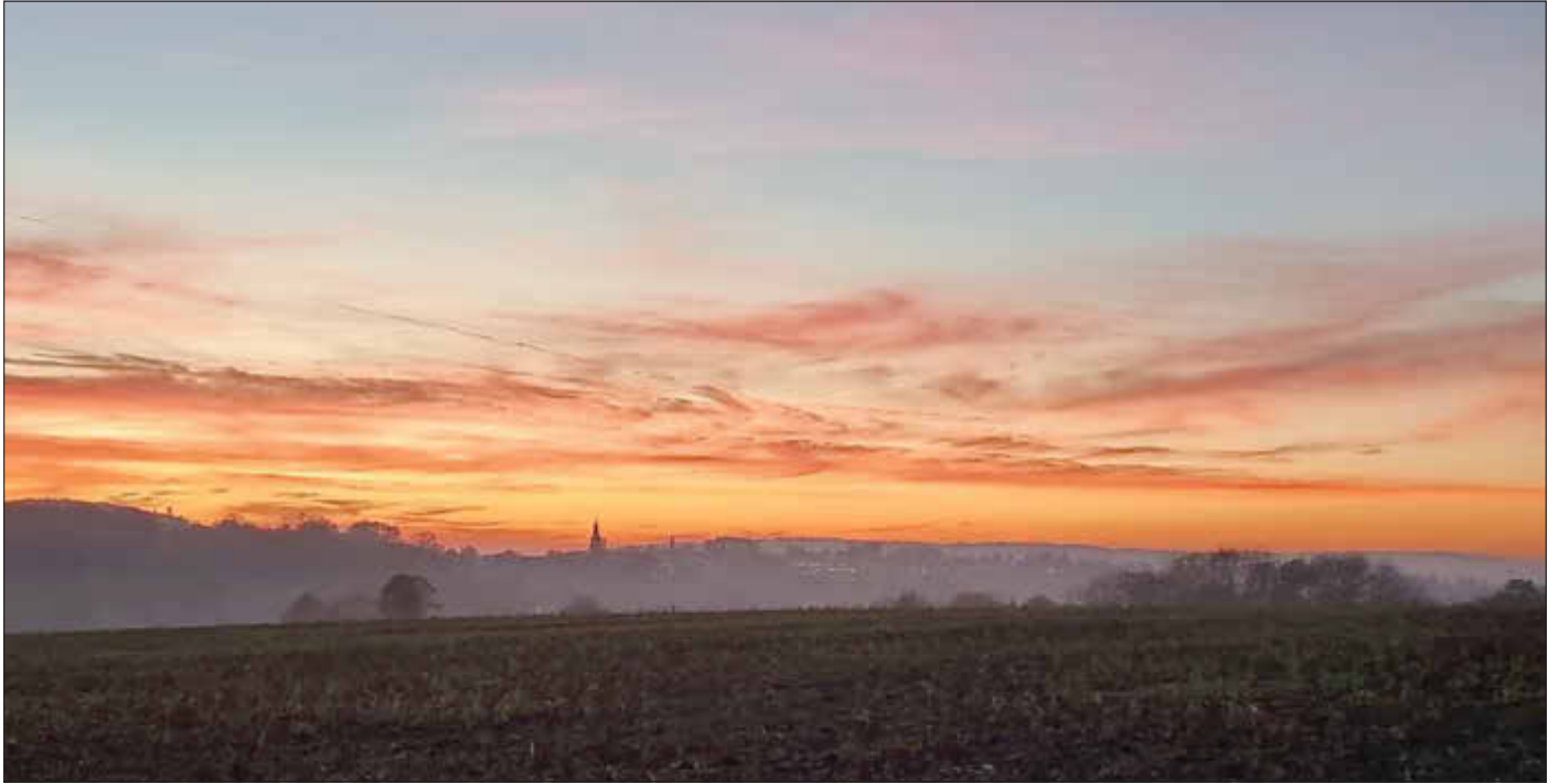
Blick auf Prächting im Sonnenuntergang - Foto: Jacqueline Schulz

Amtliches Bekanntmachungsorgan des Marktes Ebensfeld