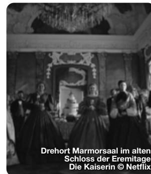
Drehort Marmorsaal im alten Schloss der Eremitage Die Kaiserin

In Bayreuth spielen nicht nur die Lauben- und Wandelgänge der Eremitage, der Teepavillon oder die nächtliche Untere Grotte, wo Sisi mit ihrem betrunkenen Vater, Herzog Max von Bayern bricht, eine Hauptrolle in der neuen Serie. Im Neuen Schloss wurde im Japanischen Zimmer und im Palmzimmer gedreht. Schloss Fantaisie wird zum österreichischen Ischl und als Franz die Verlobung bekanntgibt, zur Überraschung