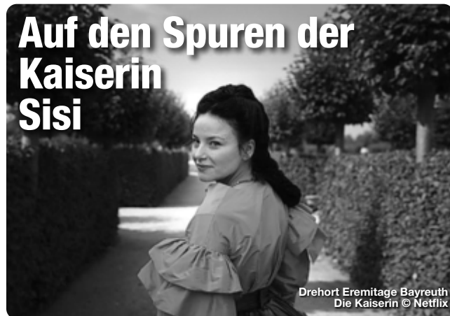
Drehort Eremitage Bayreuth Die Kaiserin