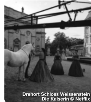
Drehort Schloss Weissenstein Die Kaiserin

Und wer etwas von der Aura der Traumphochzeit des Kaiserpaars nachempfinden möchte, sollte sich auf dem Bamberger Domplatz wiederfinden, wo das Domportal, der Domplatz und die Neue Residenz als eindrucksvolle Kulissen