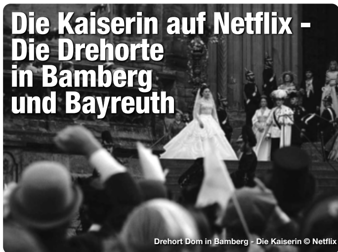
Drehort Dom in Bamberg - Die Kaiserin

Die neue Netflix-Serie „Die Kaiserin“ startet fulminant in den Herbst. Doch was nur Wenige wissen: Die Hauptdrehorte der barocken Pracht befinden sich hauptsächlich in und um Bamberg und Bayreuth. Viele sind frei zugänglich und können problemlos auf eigene Faust oder bei Führungen besichtigt werden. Für Fans ein wahres Paradies, um auf den Spuren von Sisi und Franz zu wandeln. TreffpunktDeutschland.de/bamberg-region