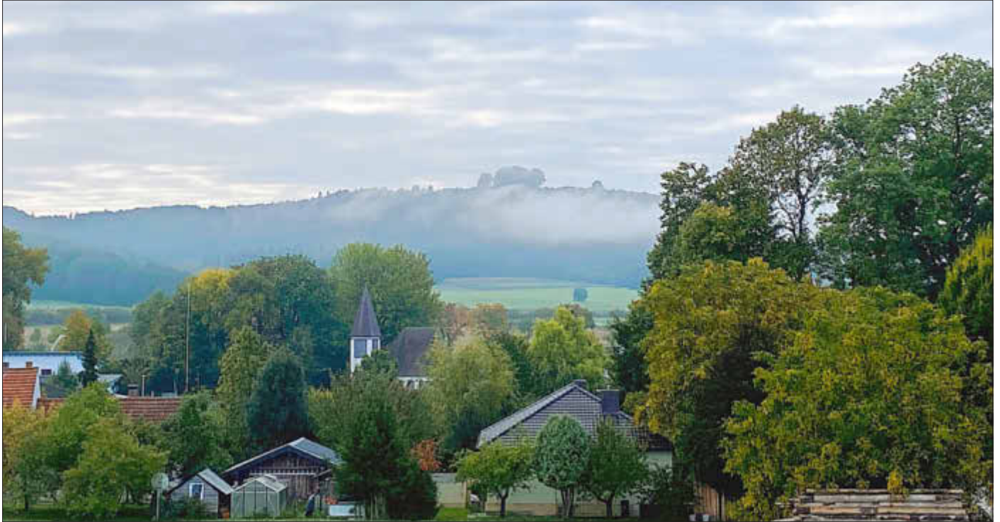
Blick auf Pferdsfeld und den Veitsberg

Amtliches Bekanntmachungsorgan des Marktes Ebensfeld