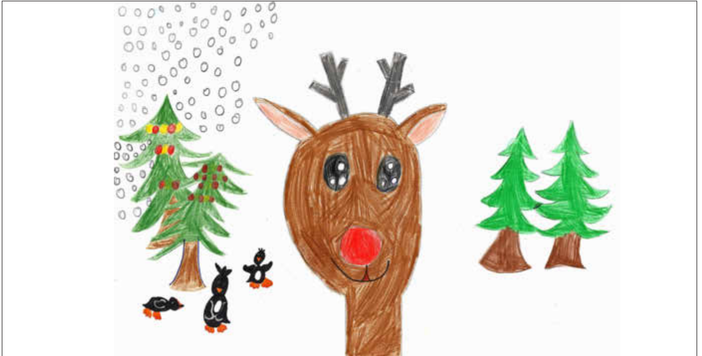
Eva Eichinger, 8 Jahre - Eine der glücklichen Gewinner beim Kindermalwettbewerb zum Thema „Weihnachten im Markt Ebensfeld“

Amtliches Bekanntmachungsorgan des Marktes Ebensfeld