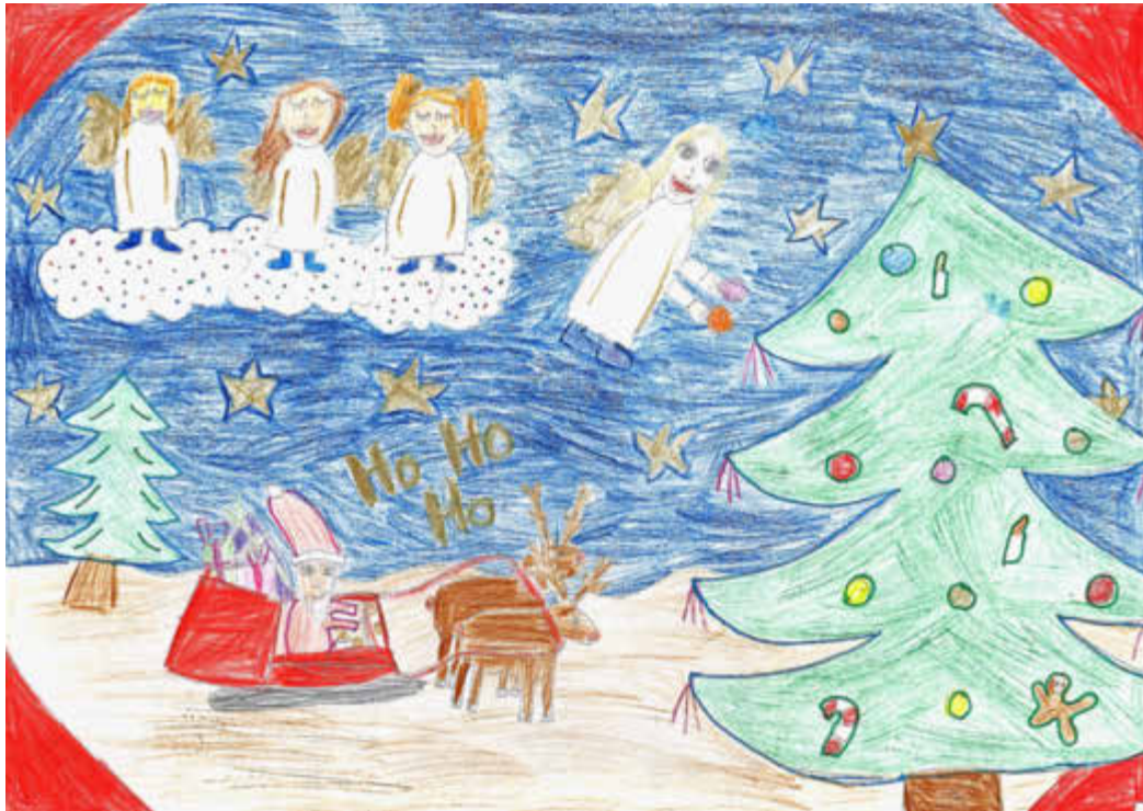
Lena Riedl, 9 Jahre - Eine der glücklichen Gewinner beim Kindermalwettbewerb zum Thema „Weihnachten im Markt Ebenfeld“

Amtliches Bekanntmachungsorgan des Marktes Ebenfeld