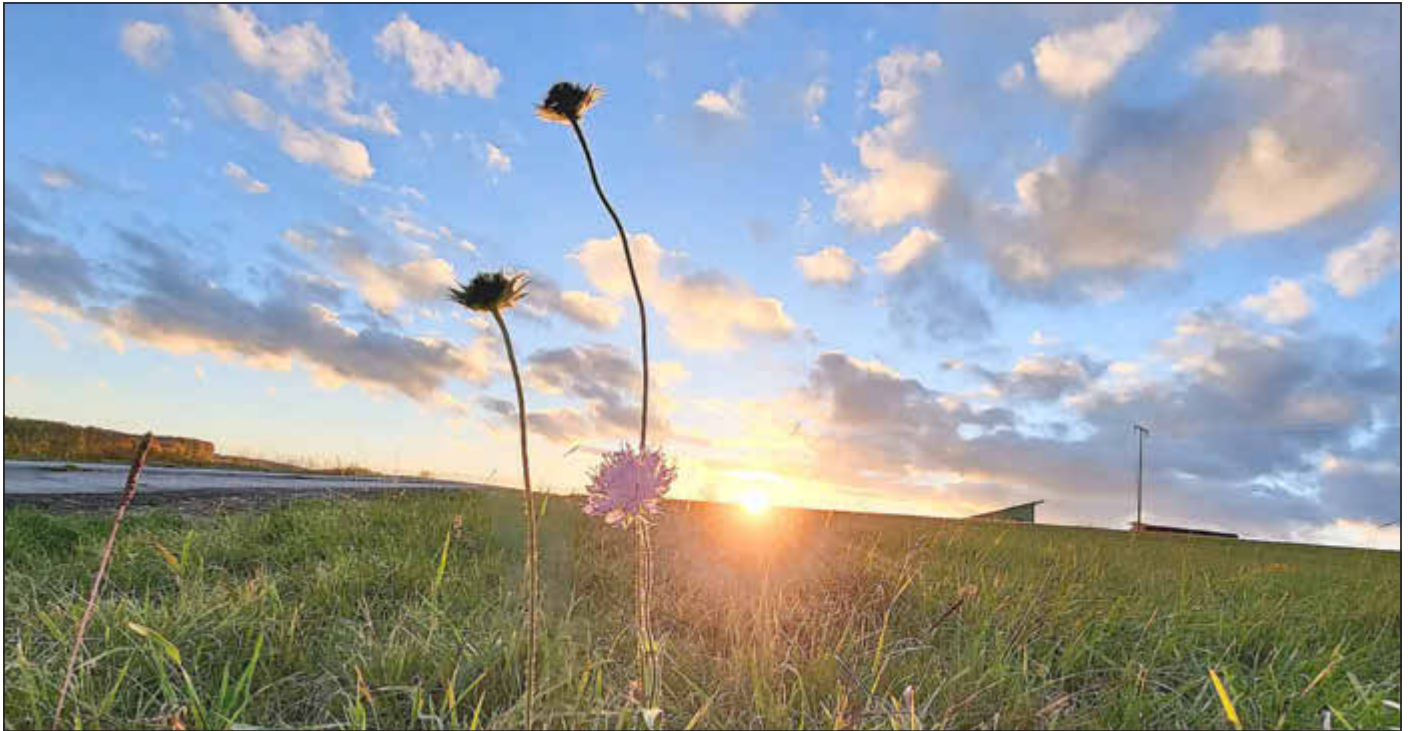
Sonnenuntergang bei Eggenbach

Amtliches Bekanntmachungsorgan des Marktes Ebensfeld