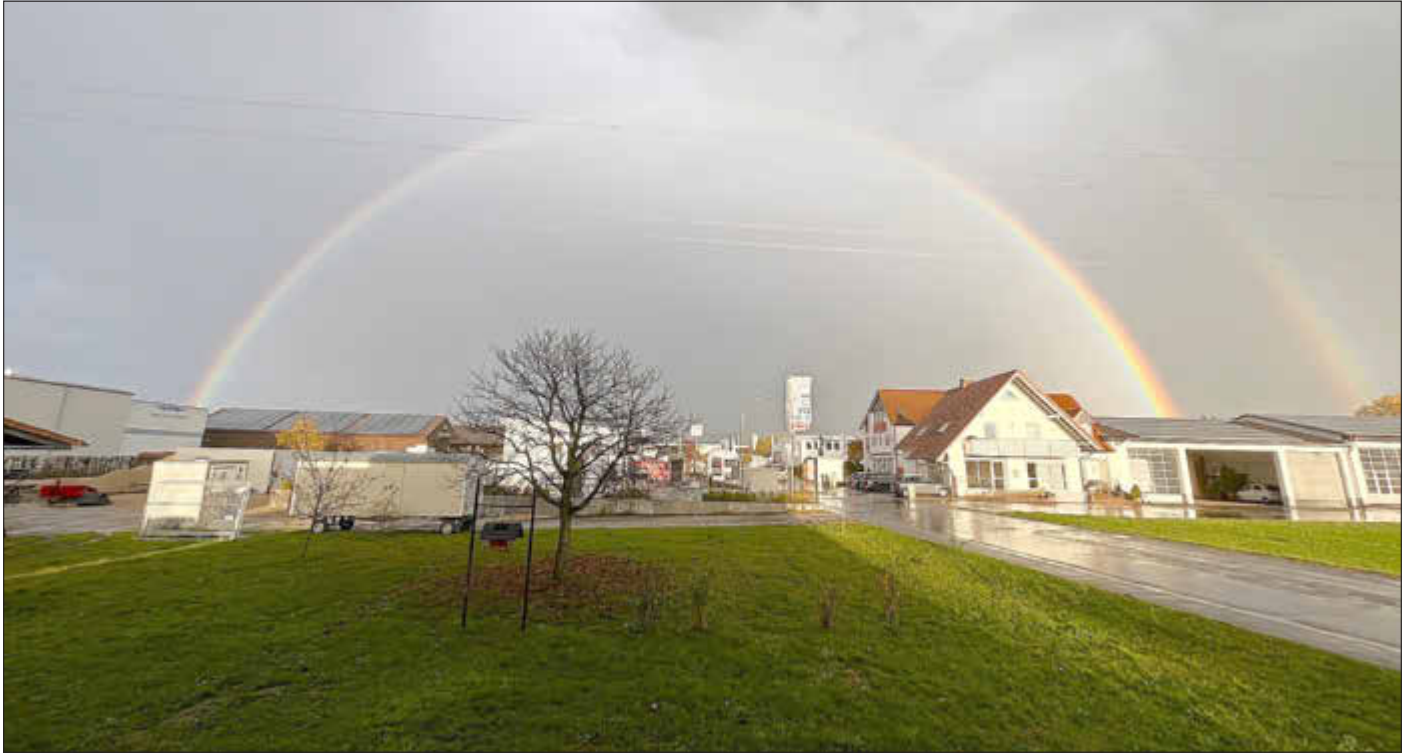
Regenbogen über dem Gottesgarten

Amtliches Bekanntmachungsorgan des Marktes Ebenfeld