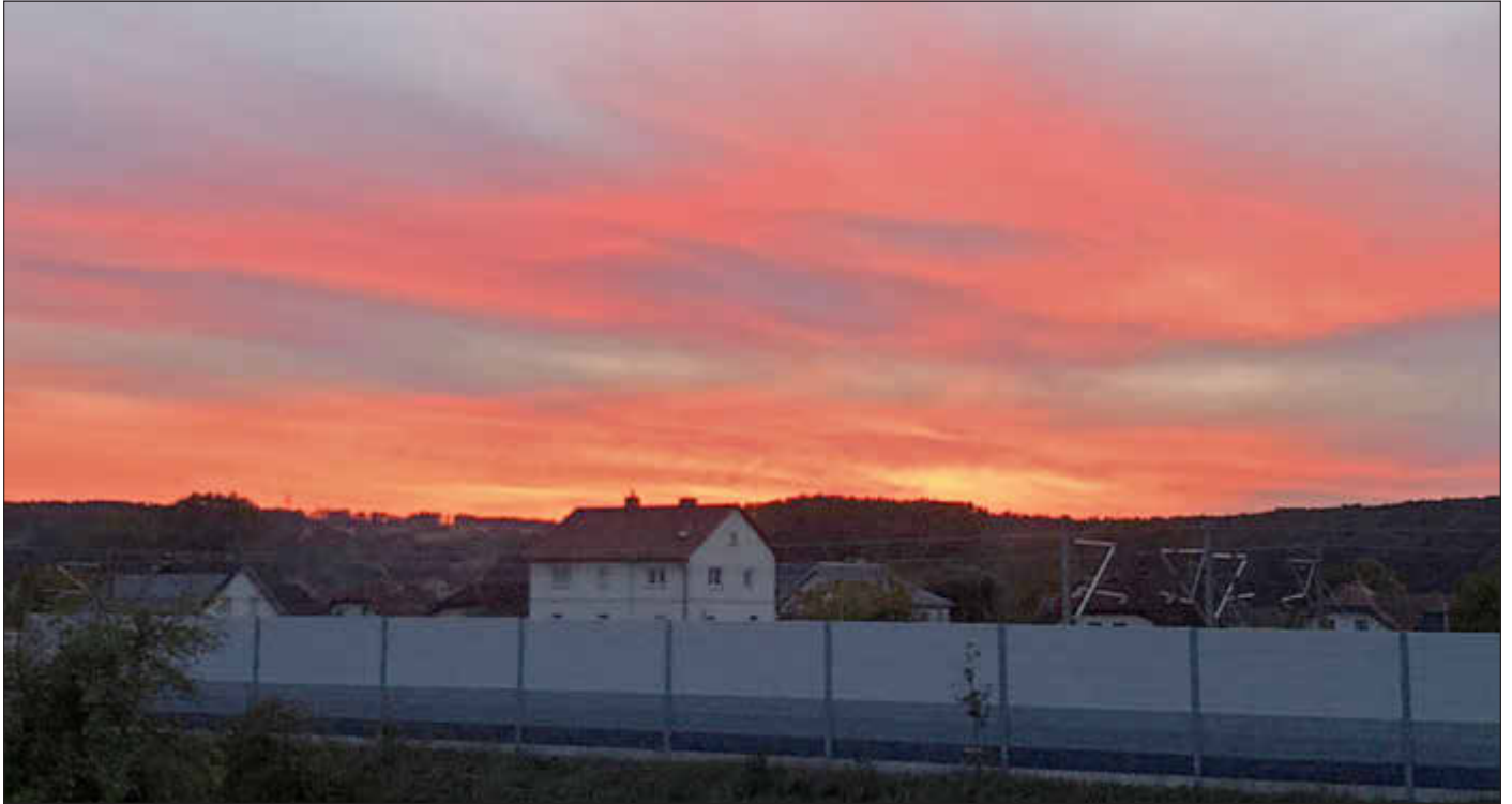
Sonnenuntergang über Ebensfeld

Amtliches Bekanntmachungsorgan des Marktes Ebensfeld