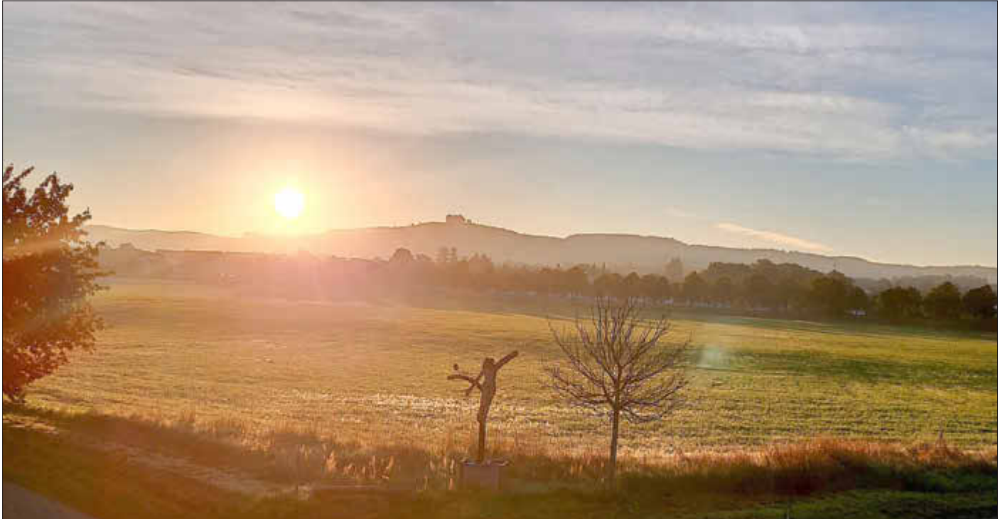
Sonnenaufgang über dem Veitsberg

Amtliches Bekanntmachungsorgan des Marktes Ebensfeld