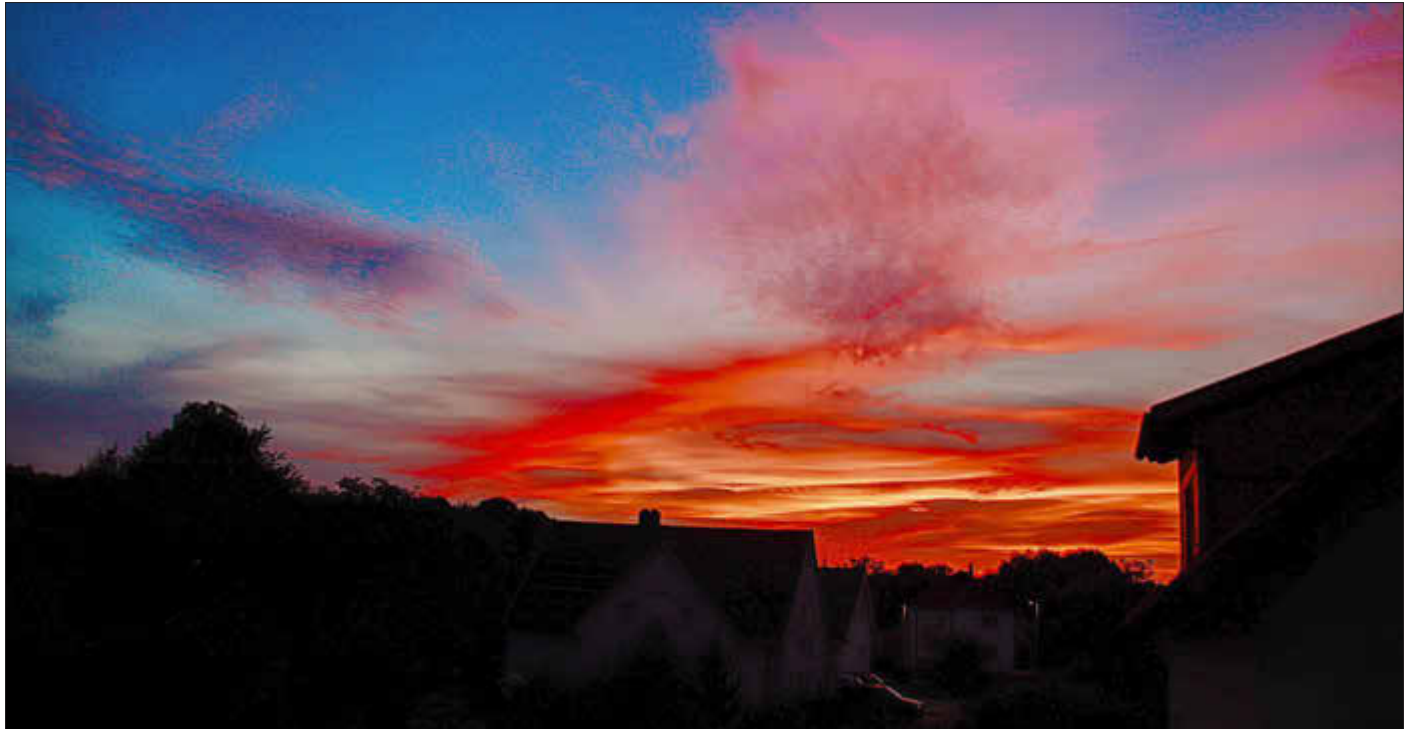
Ein Sonnenuntergang im Spätsommer über Döringstadt

Amtliches Bekanntmachungsorgan des Marktes Ebensfeld