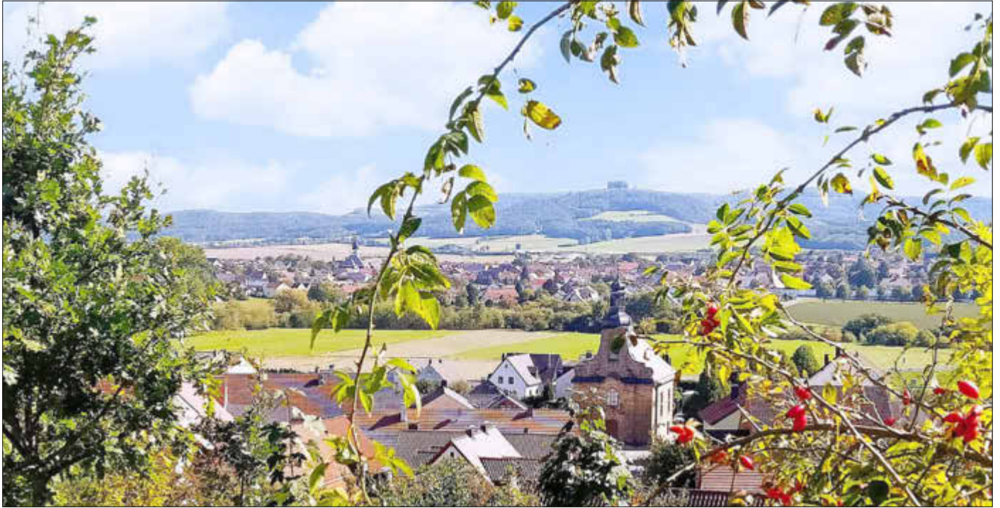
Blick auf Oberbrunn und Ebensfeld

Amtliches Bekanntmachungsorgan des Marktes Ebensfeld