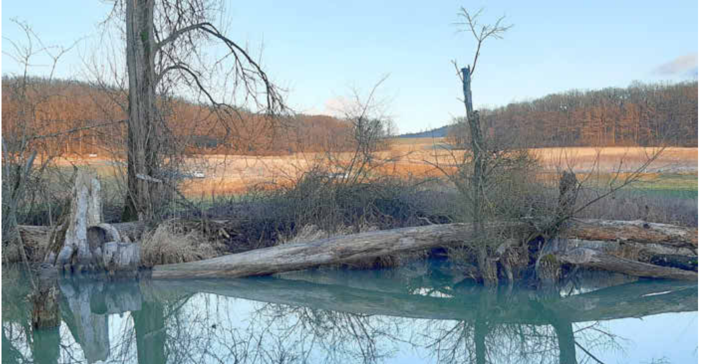
Am Biberbau im Markt Ebenfeld

Amtliches Bekanntmachungsorgan des Marktes Ebenfeld