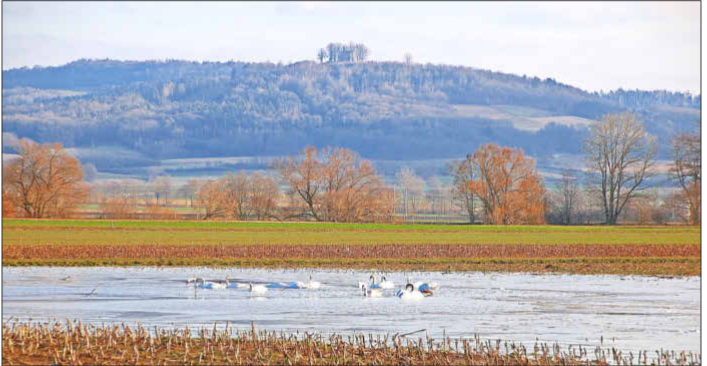
Schwäne im Hochwasser

Amtliches Bekanntmachungsorgan des Marktes Ebensfeld