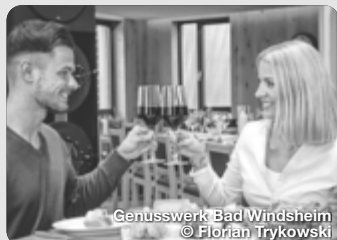
Genusswerk Bad Windsheim