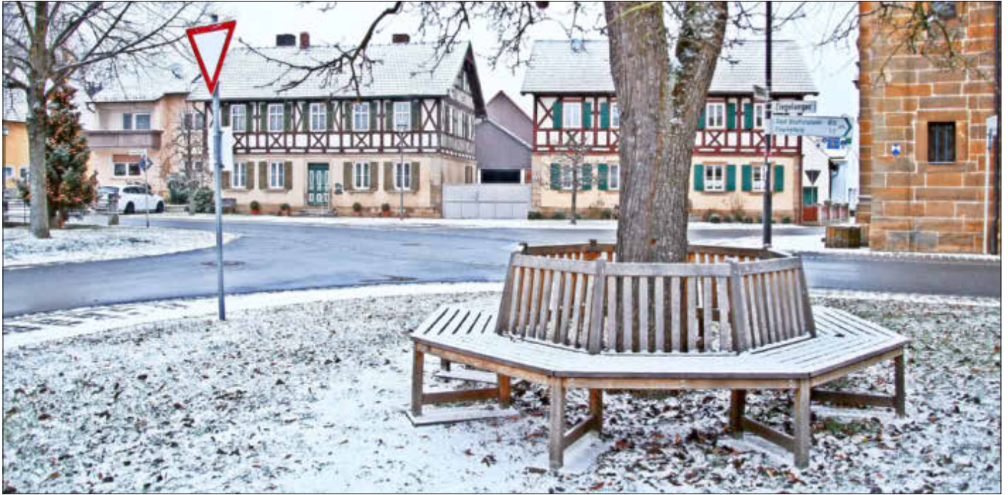
Der erste Schnee im neuen Jahr

Amtliches Bekanntmachungsorgan des Marktes Ebensfeld