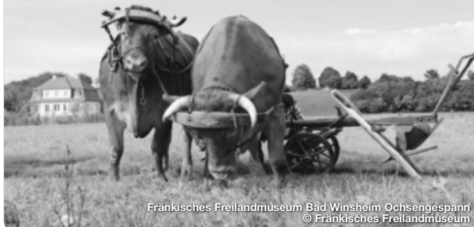
Fränkisches Freilandmuseum Bad Windsheim Ochsengepann

Eingebettet in die Naturparke Steigerwald und Frankenhöhe, lässt sich Frankens Mehrregion besonders gut zu Fuß oder mit dem Rad erkunden. Mit seiner landschaftlichen, kulturellen und kulinarischen Vielfalt ist der Landkreis Neustadt a.d. Aisch-Bad Windsheim ein idealer Ausgangspunkt für aktive Erlebnistouren und eine wohltuende Auszeit inmitten herrlicher Natur.