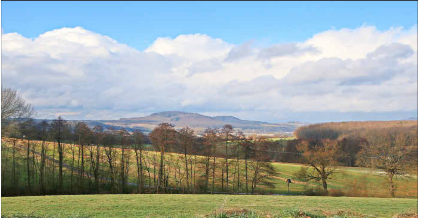
Ausblick auf die Eierberge

Amtliches Bekanntmachungsorgan des Marktes Ebenfeld