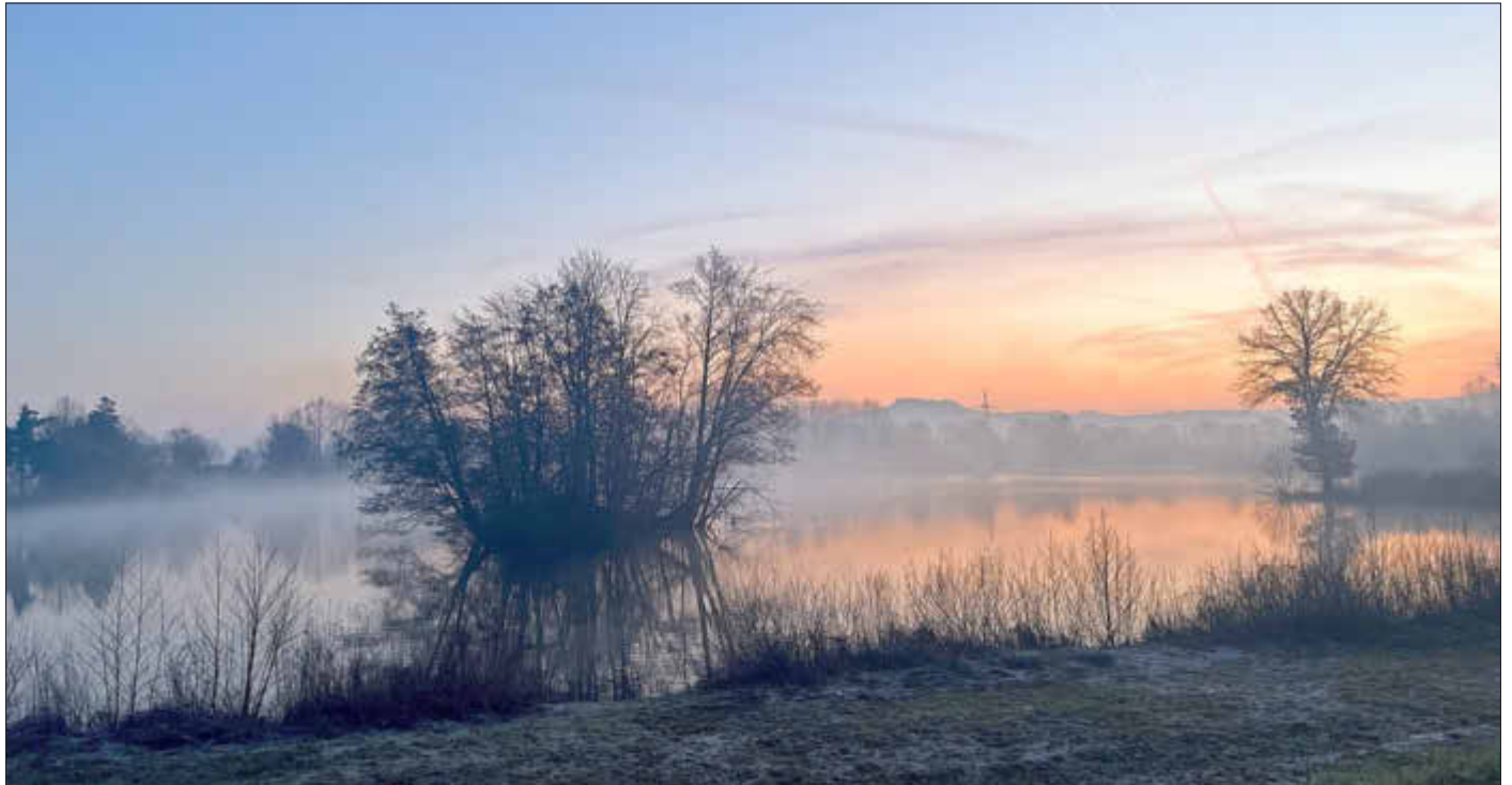
Sonnenaufgang am Baggersee

Amtliches Bekanntmachungsorgan des Marktes Ebenfeld