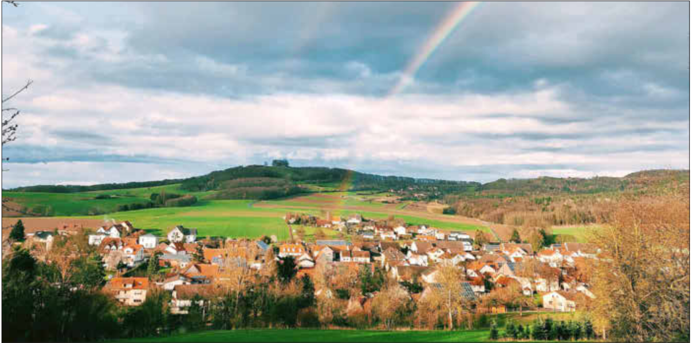
Regenbogen über Prächting

Amtliches Bekanntmachungsorgan des Marktes Ebensfeld