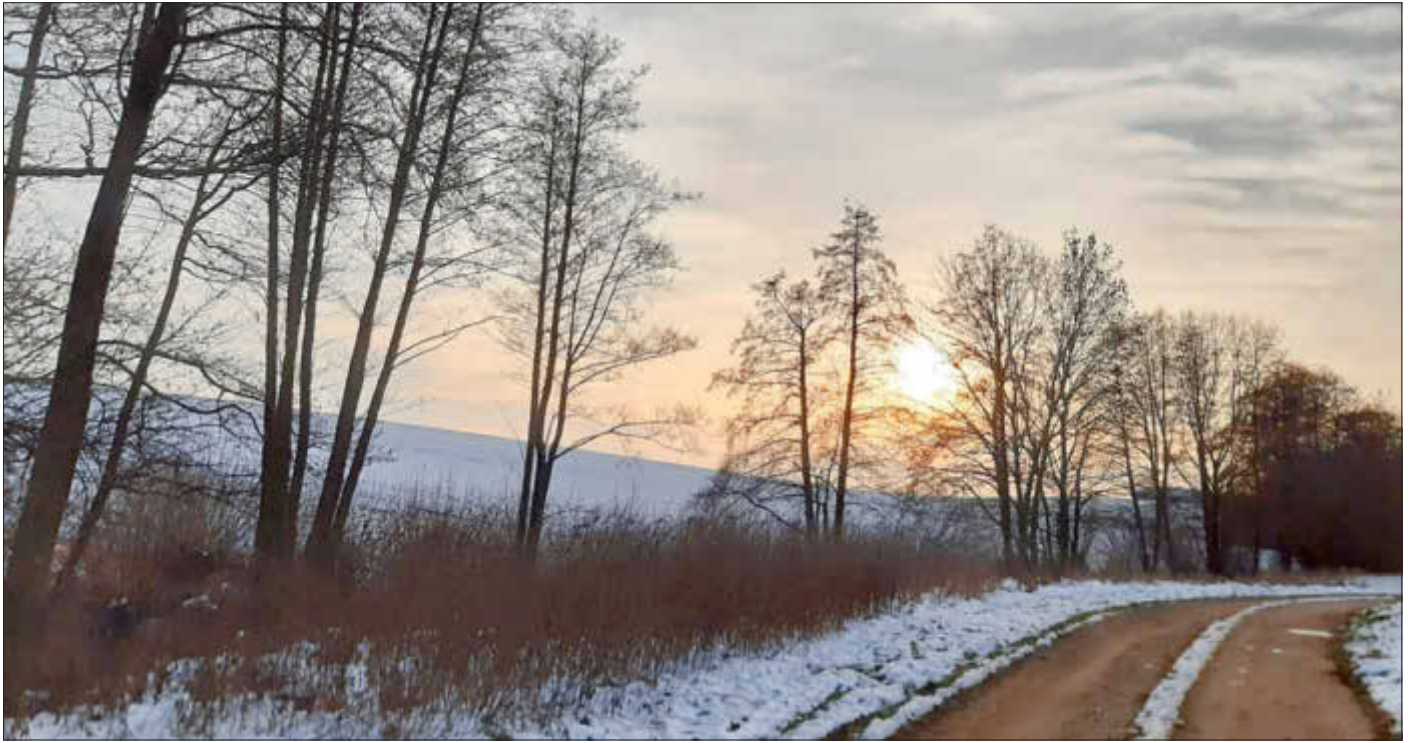
Winterliche Abendstimmung zwischen Kleukheim und Kümmel - Foto: Hildegard Sommer

Amtliches Bekanntmachungsorgan des Marktes Ebenfeld