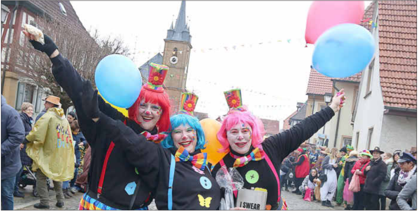
Faschingsumzug in Kleukheim

Amtliches Bekanntmachungsorgan des Marktes Ebensfeld