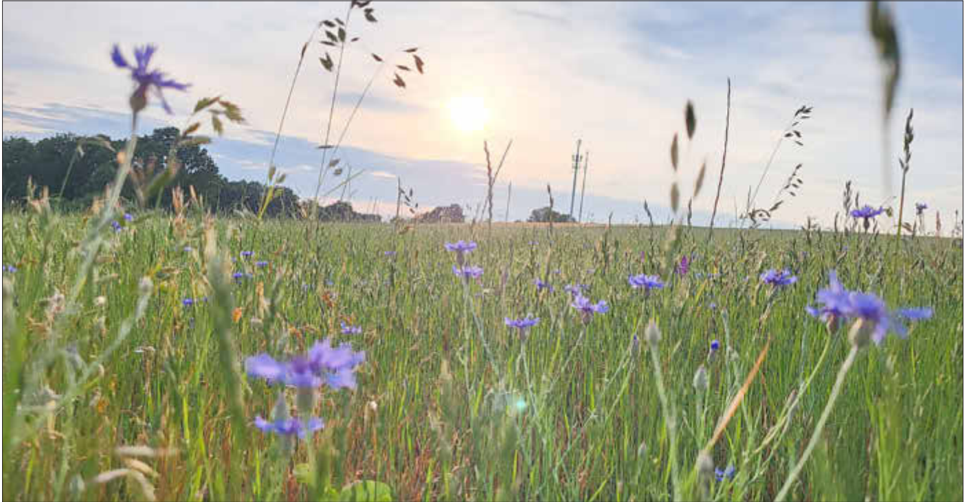
Sommerliche Abendstimmung im Gottesgarten

Amtliches Bekanntmachungsorgan des Marktes Ebensfeld