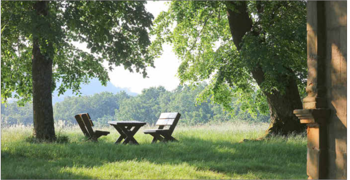
Ein schattiges Plätzchen unter den Linden am Veitsberg

Amtliches Bekanntmachungsorgan des Marktes Ebenfeld