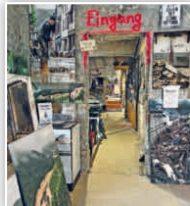
... die außer vielen Bildern auch mehrere Filmsequenzen beinhaltet.

AHRTAL. AFi. Auch fast zwei Jahre nach der verheerenden Flut ist das Ausmaß der Schäden entlang der Ahr weiterhin gegenwärtig. An vielen Stellen sieht es auf den ersten Blick noch immer nicht danach aus – doch es geht voran. Inhaber von Hotels, Restaurants und Geschäften haben, samt ihrer Mitarbeiter*innen, unzählige Stunden Arbeit, verbunden mit viel Hoffnung und Mut, in den Wiederaufbau ihrer geschäftlichen Existenzen gesteckt. Das Ziel: Endlich wieder zahlreiche Tages- und Übernachtungsgäste sowie Kundinnen und Kunden begrüßen zu können. Wanderfreudige Besucher*innen des Ahrtals dürfen sich, neben unvergesslichen Stunden in grandioser Natur entlang