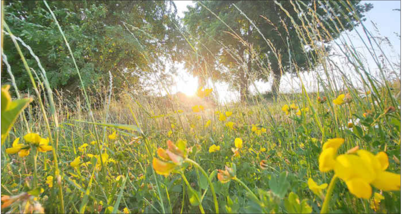
Sommerblüte im Markt Ebensfeld

Amtliches Bekanntmachungsorgan des Marktes Ebensfeld