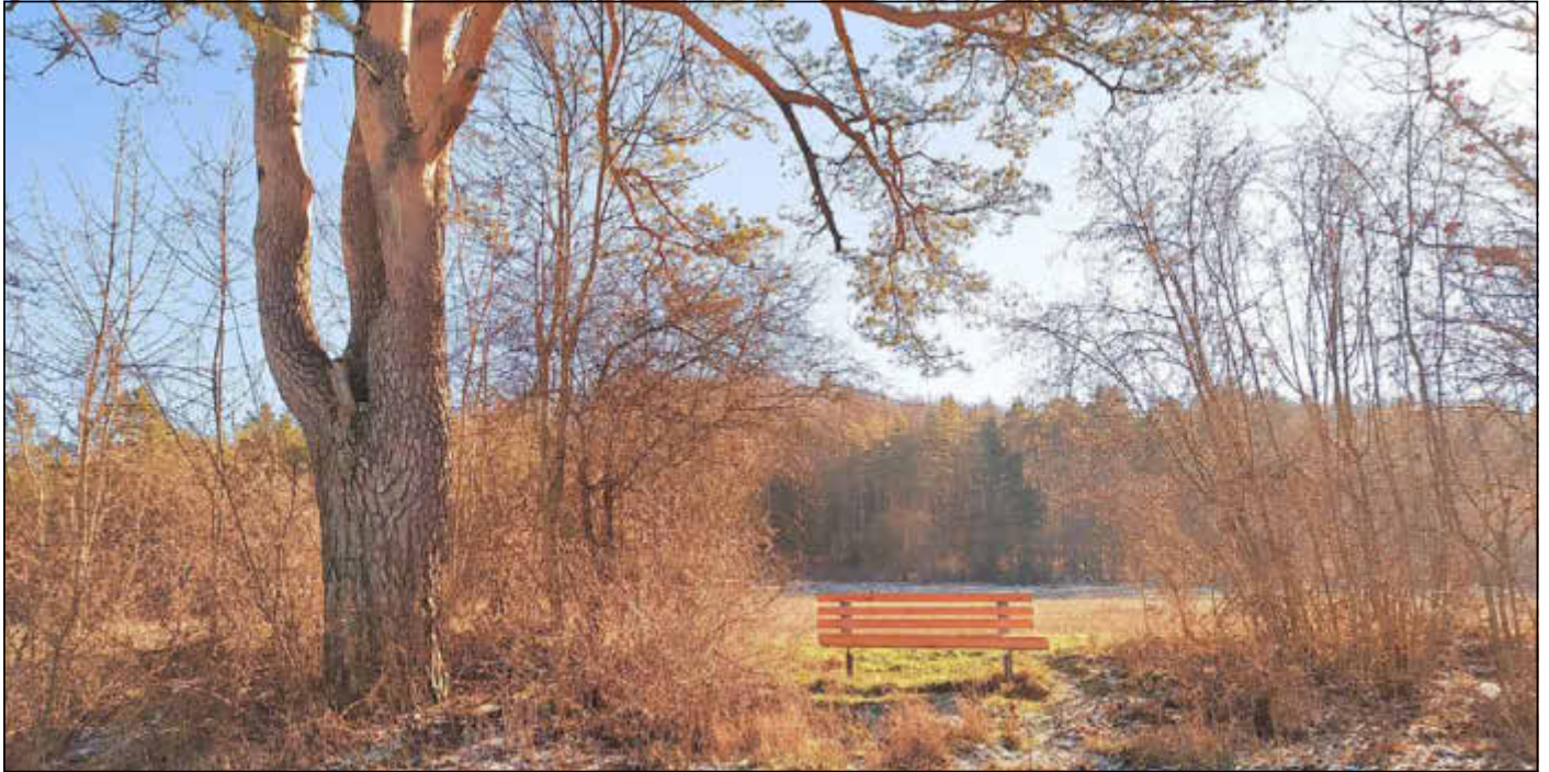
Ruhebank am Dornig

Amtliches Bekanntmachungsorgan des Marktes Ebenfeld