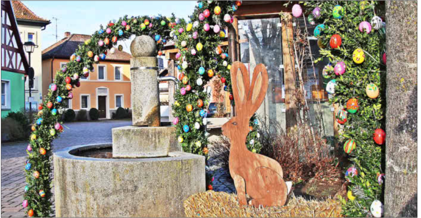
Osterbrunnen in Kleukheim

Amtliches Bekanntmachungsorgan des Marktes Ebensfeld