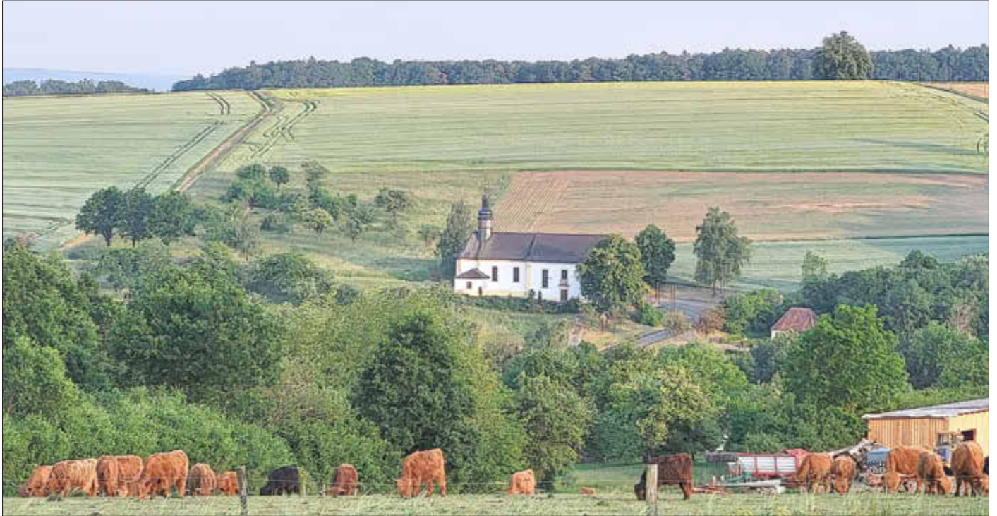
Blick auf die Wallfahrtskirche „Mariä Schmerz“ Eggenbach

Amtliches Bekanntmachungsorgan des Marktes Ebenfeld