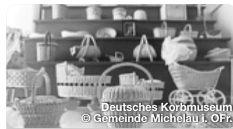
Deutsches Korbmuseum

Ein ganzer Tag rund ums Bier! Für die Brauereien ist es Ehrensache, in der „guten Stube“ der Stadt ihre handwerklich gebrauten Bierspezialitäten zu präsentieren und auszuschenken.