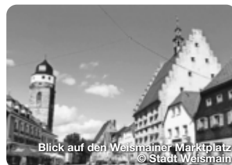
Blick auf den Weismainer Marktplatz

Weithin sichtbar strahlt die charakteristische Silhouette Burgkunstadts in das obere Maintal. Das historische Rathaus ist ein wahres Schmuckstück. TreffpunktDeutschland.de/burgkunstadt