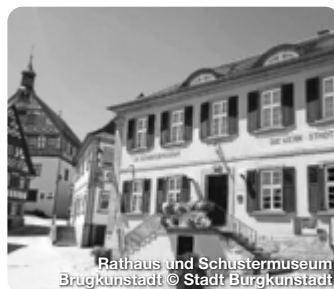
Rathaus und Schustermuseum Brugkunstadt

Das Museum geht zurück auf eine 1929 angelegte Sammlung. Seit 1934 besteht das Museum, das ursprünglich drei Zimmer umfasste; heute dagegen werden auf etwa 850 Quadratmetern in 26 Schau-räumen fast 2000 Exponate aus aller Welt präsentiert. Bismarckstraße 4, Michelau