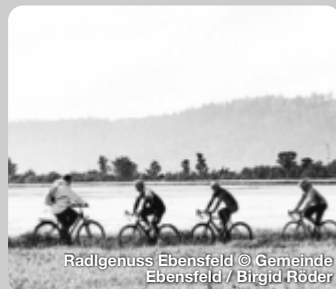
Radlgenuss Ebensfeld