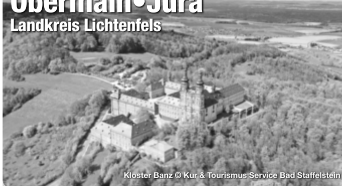
Kloster Banz © Kur &amp; Tourismus Service Bad Staffelstein

Der Obermain•Jura ist eine kleinteilige Kulturlandschaft im „Gottesgarten am Obermain“, weltberühmte barocke Baudenkmäler und eine so alte, wie lebendige Handwerkskunst machen den Obermain•Jura zu einem ganz besonderen Flecken Erde.