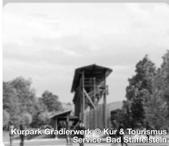
Kurpark Gradierwerk

Hügel, satte Wälder und breite Flussauen des Mains prägen den „Gottesgarten“ im Obermain•Jura – eine ideale Landschaft für entspannende Wander-, Rad- und Bootstouren. Neue Kraft tankt man auch bei einem Besuch der „Obermain Therme“ in Bad Staffelstein, wo Bayerns stärkste und wärmste Thermalsole die Becken speist. TreffpunktDeutschland.de/obermain-jura