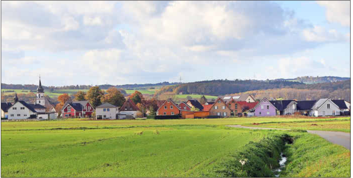
Blick auf Ebensfeld

Amtliches Bekanntmachungsorgan des Marktes Ebensfeld