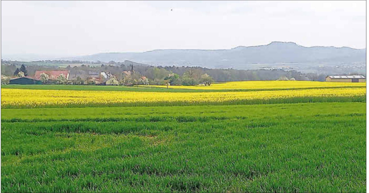
Blühende Rapsfelder im Markt Ebensfeld - Foto: Georg Schauer

Amtliches Bekanntmachungsorgan des Marktes Ebensfeld