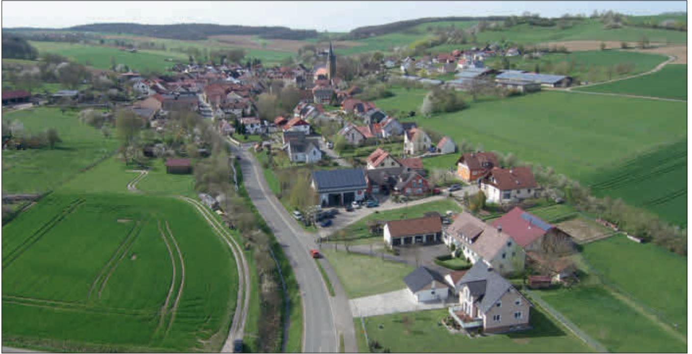
Döringstadt von oben -

Amtliches Bekanntmachungsorgan des Marktes Ebensfeld