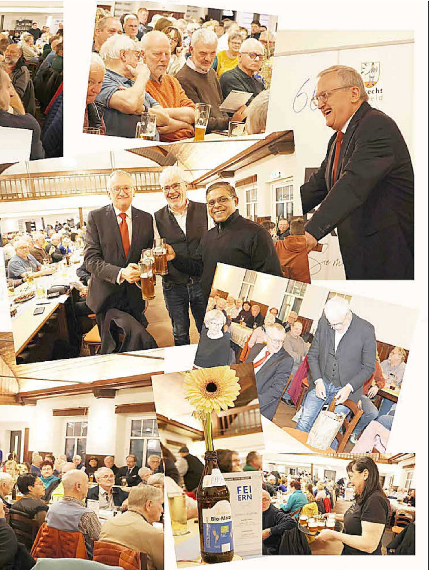
„Geschichte lebendig erzählt“