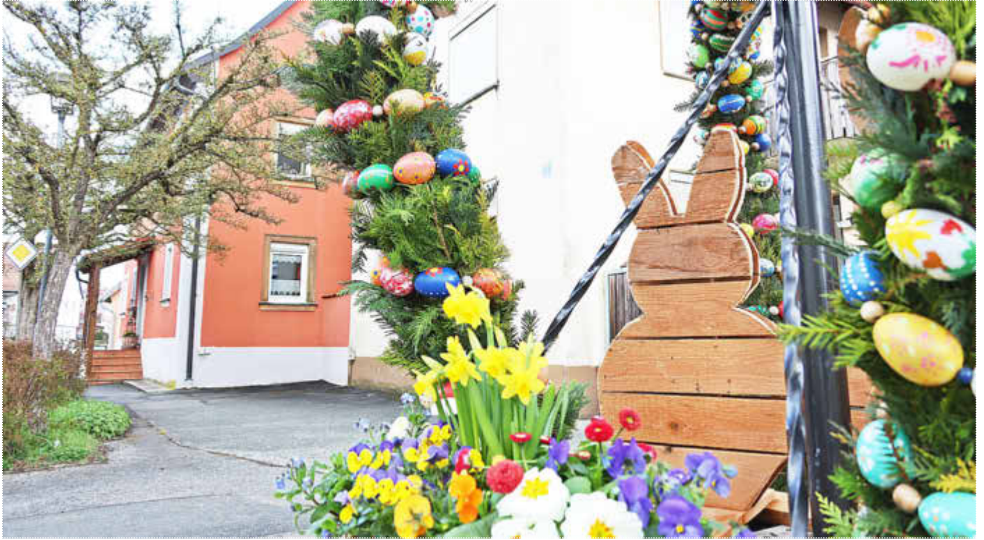
Osterbrunnen in der Unteren Straße in Ebenfeld

Amtliches Bekanntmachungsorgan des Marktes Ebenfeld